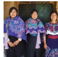
Portada: Estos rostros con la ceniza en la frente son el testimonio de la fe que es vivencial entre las mujeres de la cultura Maya. Imagen tomada en el municipio de Zinacantán, Chiapas (México)